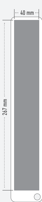
Druck im Satzspiegel trim