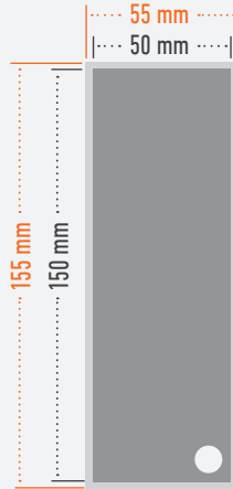
Druck im Anschnitt bleed